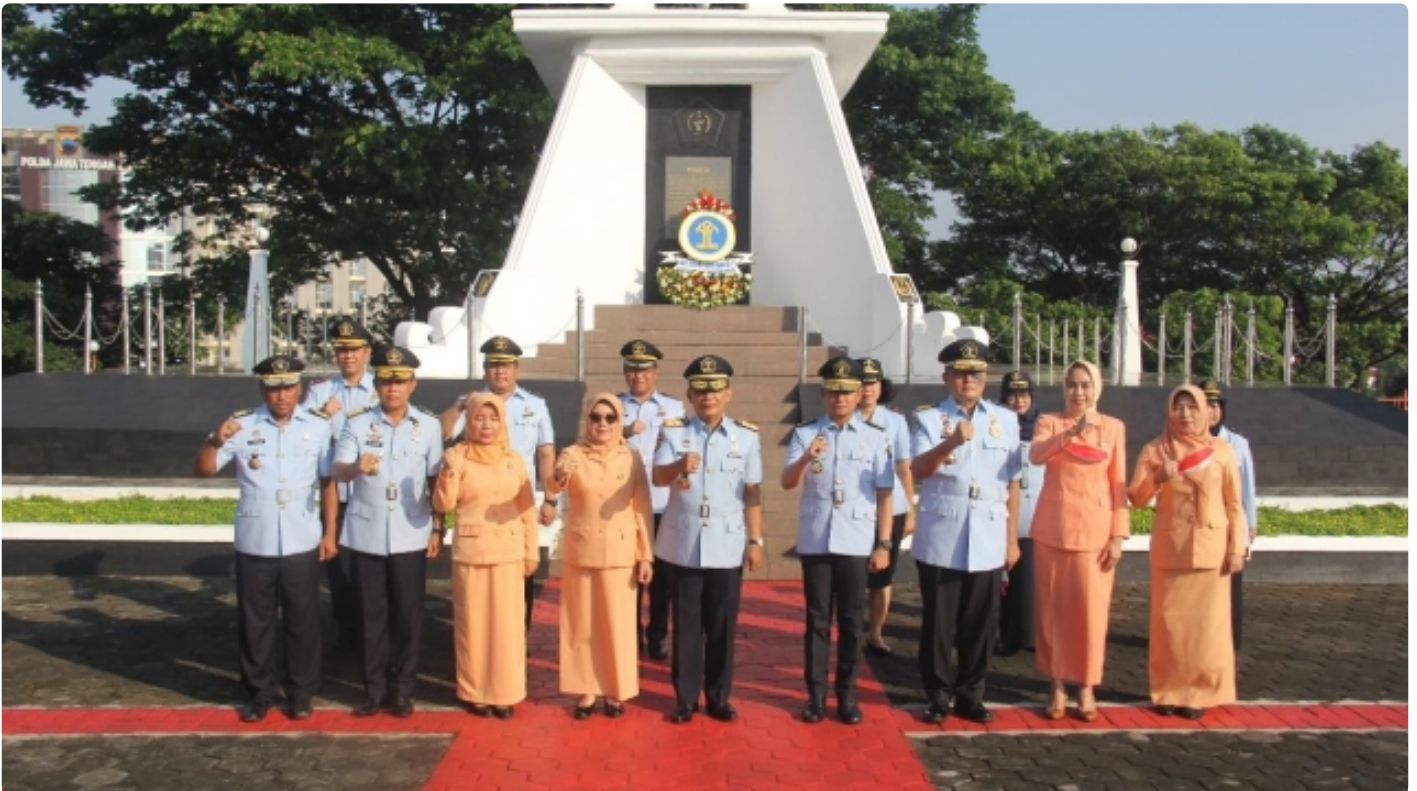
Sambut Hari Dharma Karyadhika Ke-77, Kemenkumham Jateng Gelar Upacara Tabur Bunga di TMP Giri Tunggal

SEMARANG - Bangsa yang besar adalah bangsa yang menghargai jasa para pahlawannya. Atas dasar itu, jajaran Kantor Wilayah Kementerian Hukum dan HAM Jawa Tengah menggelar Ziarah dan Upacara Tabur Bunga di Taman Makam Pahlawan (TMP) Giri Tunggal dalam rangkaian memperingati Hari Dharma Karya Dhika Ke-77 Tahun 2022, Jumat (12/08/2022).